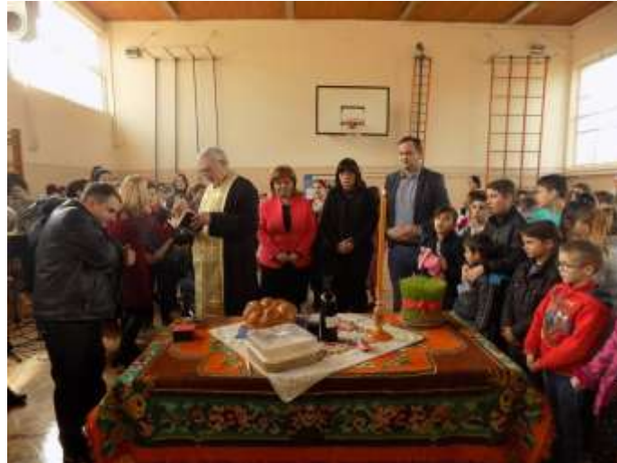
Сечење славског колача

Школску славу смо прославили приредбом у физкултурној сали. Захваљујемо се свим учесницима и публици, а посебну захвалност упућујемо нашим кумовима славе, који су у помогли у омогућавању бољих услова за рад наше школе.