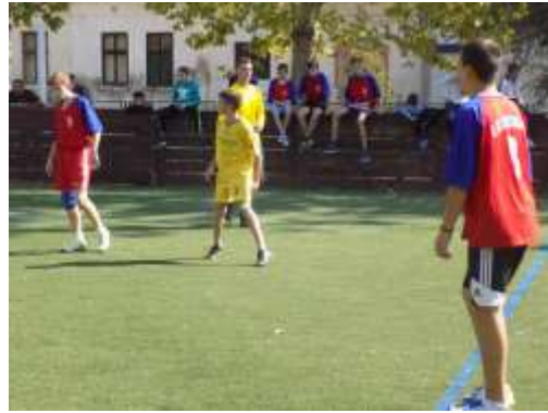
Пријатељска фудбалска утакмица