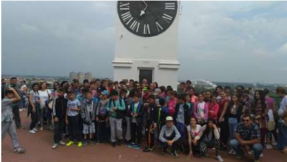
ЕКСКУРЗИЈА- НОВИ САД, ПЕТРОВАРАДИН