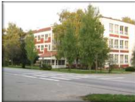
ОШ ”1.октобар” Башаид

У школској 2017/2018. години наша школа броји 315 ђака распоређених у 18 одељења од 1. до 8. разреда. Школа има значајну улогу у културном и спортском животу села, а опремљена је савременим наставним средствима. Настава се изводи на српском језику, а међу ученицима налазе се ученици српске, мађарске и ромске националности. У школи ради доста млад колектив који се труди сваким даном да унапреди наставни процес и квалитет основног образовања и васпитања.