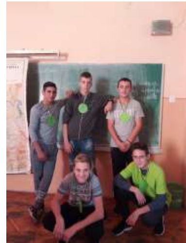
Освојене медаље током Дечје недеље