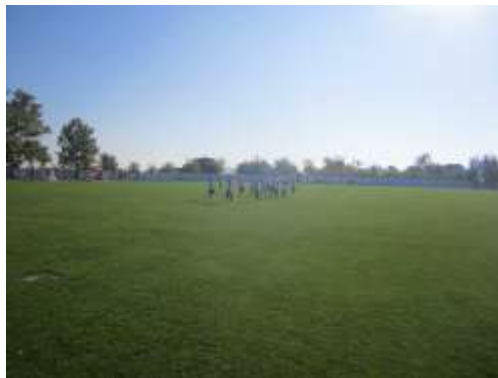
Поздрав са јесењег кроса

16.10.2017. одржан је школски, јесењи крос на стадиону ФК „Војводина" у Башаиду у ком су учествовали ученици од првог до осмог разреда. Такмичење је било по разредима/генерацијама у мушкој и женској категорији, а резултати су на завидном нивоу. Честитамо свим учесницима!