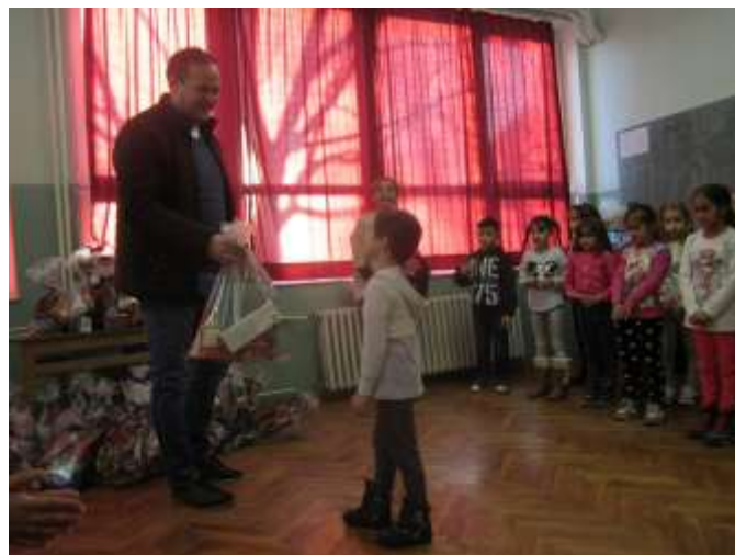
Председник Месне заједнице са првацима

Како другачије када смо први пут школски свечари!